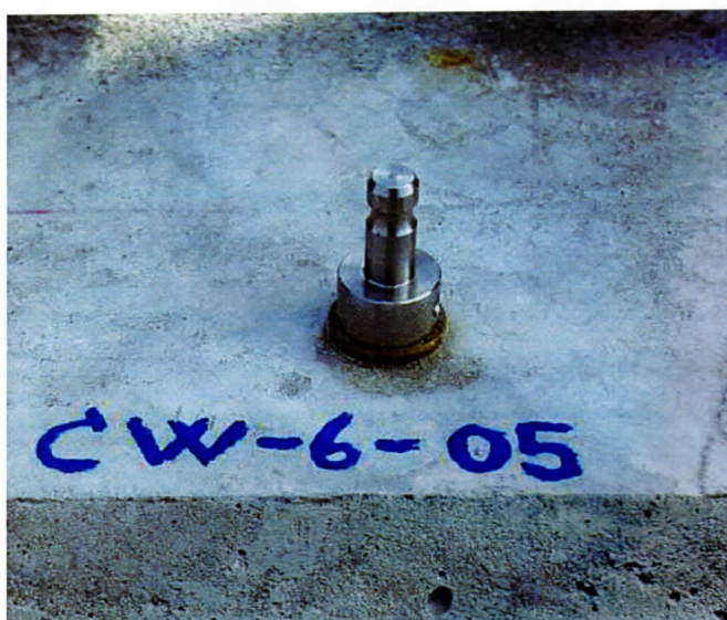
Facadebolt under anlæg