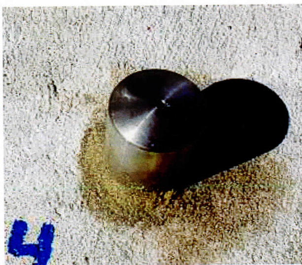
Lodret bolt (zoom)