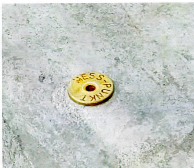
Facadebolt efter anlæg